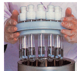
-78 °C 冷卻實驗