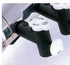
可接 filter 防污染