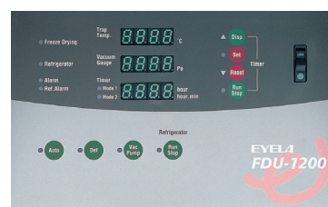
FDU-1200 · 2200 操作面板